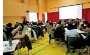
介護予防サポーター養成講座 フォローアップ研修

介護のことを始め色々なご相談を頂いてます。当センターで対応が難しい場合、他の対応できる機関におつなぎします。また介護予防活動や、地域の事業所や行政機関などの連携を強めるための地域活動なども行っています。困ったことがありましたら、お近くの地域包括支援センターまで、先ずはお気軽にお電話ください！