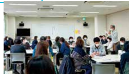
地域ケア会議「たかしなネットワークの会」

介護のことを始め色々なご相談を頂いてます。当センターで対応が難しい場合、他の対応できる機関におつなぎします。また介護予防活動や、地域の事業所や行政機関などの連携を強めるための地域活動なども行っています。困ったことがありましたら、お近くの地域包括支援センターまで、先ずはお気軽にお電話ください！